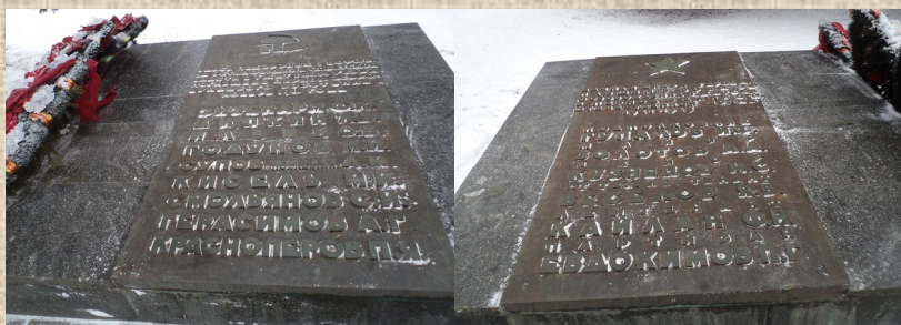
Братское захоронение №1

Введена в ОБД «Мемориал» как официальное (и единственное) описание существующего захоронения, не отражающее проведенной ранее реконструкции братской могилы, созданной на этом месте в годы войны.}, в 1955 году сюда же перезахоронены останки погибших из 29-й гвардейской стрелковой дивизии, которая первой вошла в Гжатск, и погибшие партизаны. В настоящее время, после реконструкции площади, братское захоронение представляет собой два надмогильных прямоугольника размером 3х6 метров, облицованных черным мрамором. По данным Гагаринского военкомата на 1991 год, здесь значатся захороненными останки 60 воинов и партизан. Имена шести человек известны: майор Золотов Александр Андреевич, майор Гупалов И., майор Кузнецов Михаил Степанович, ст. техник-лейтенант Веселов Я.В., лейтенант Кайлан Ф., партизан Евдокимов Павел Григорьевич