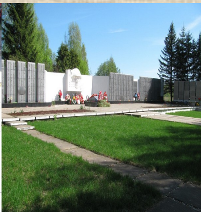
Братское захоронение №2