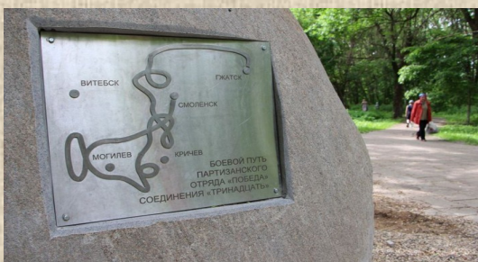
Боевой путь партизанского отряда «Победа» соединения «Тринадцать»