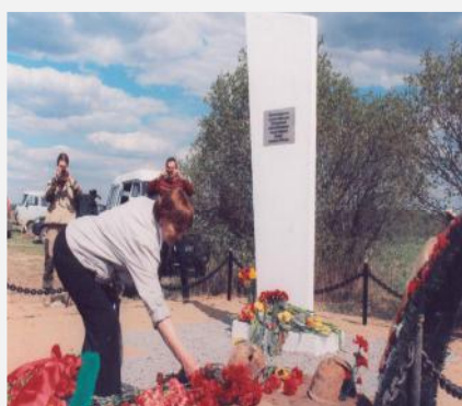
К подножию памятника приглашенные гости и родственники погибших возложили цветы.