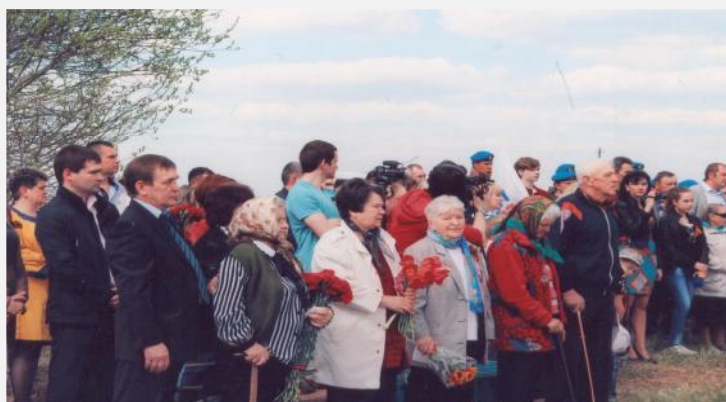
Родственники погибших солдат

После захоронения солдат память павших почтили минутой молчания. В торжественные минуты слезы грусти и все же радости были на глазах родственников погибших Солдат Победы—тех, в честь кого исполнена дань их героизму.